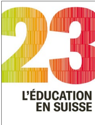
Centre suisse de coordination pour la recherche en éducation CSRE (2023): L'éducation en Suisse, rapport 2023