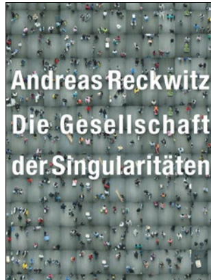
Andreas Reckwitz (2017): La société des singularités. Berlin: Suhrkamp